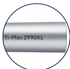
Per attacco Kavo ®

Compatibile con gli attacchi maggiormente utilizzati: