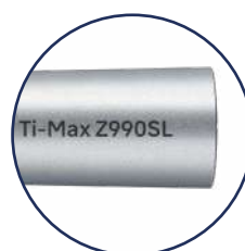
Per attacco Sirona ®