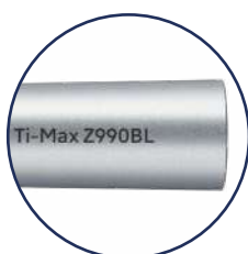
Per attacco Bien-Air ®