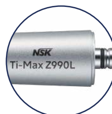
Per attacco NSK