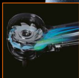
DYNAMIC POWER SYSTEM