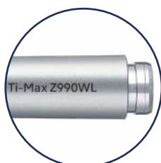
Per attacco W&H ®